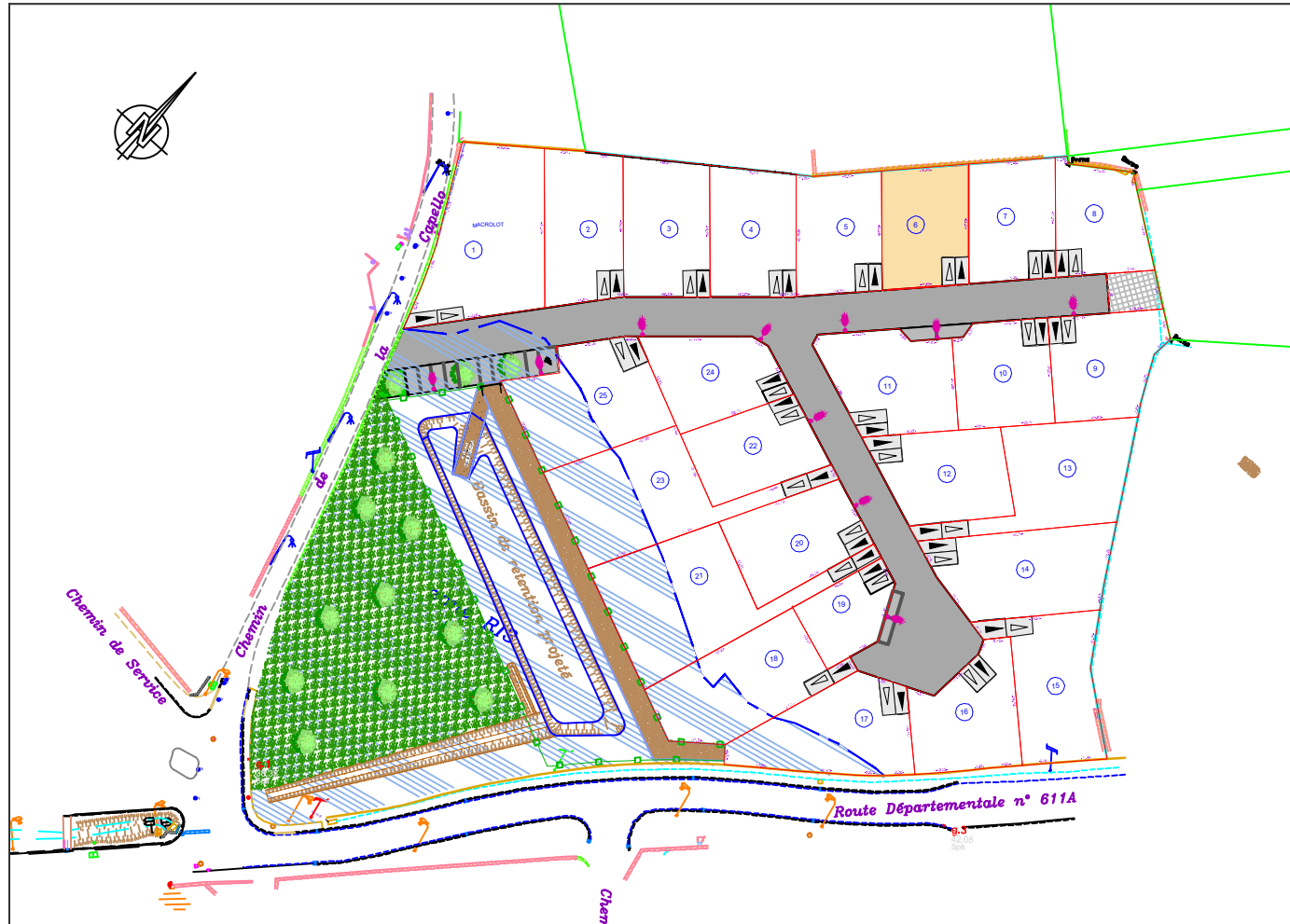
Plan de situation - sans échelle